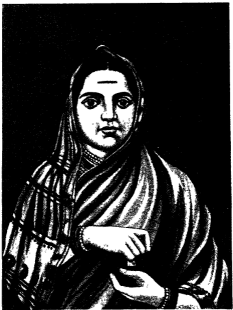
महारानी अहल्याबाई होलकर